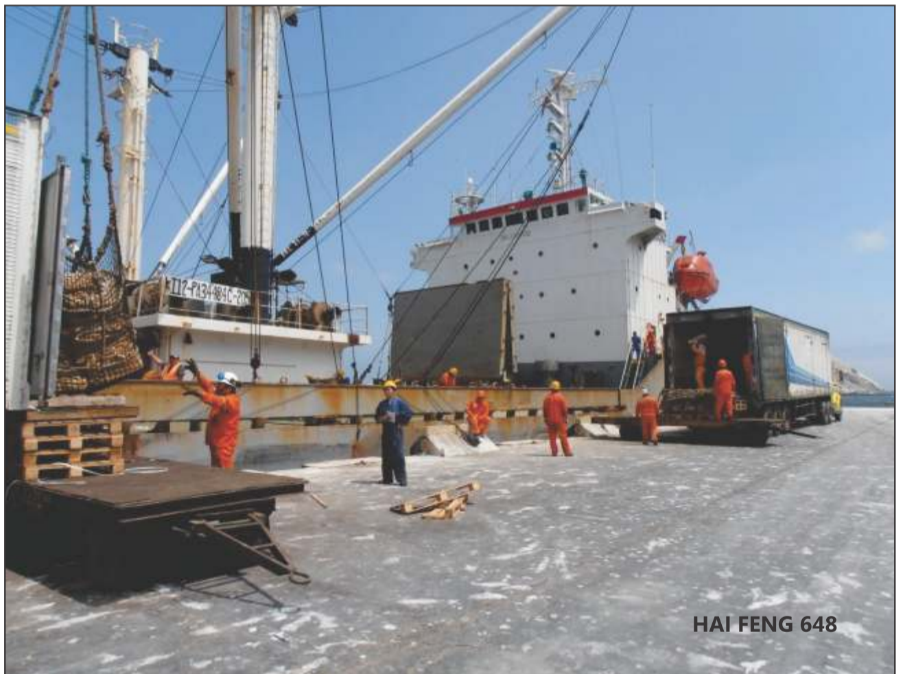
HAI FENG 648

sable para nacionalizar dicha mercadería.